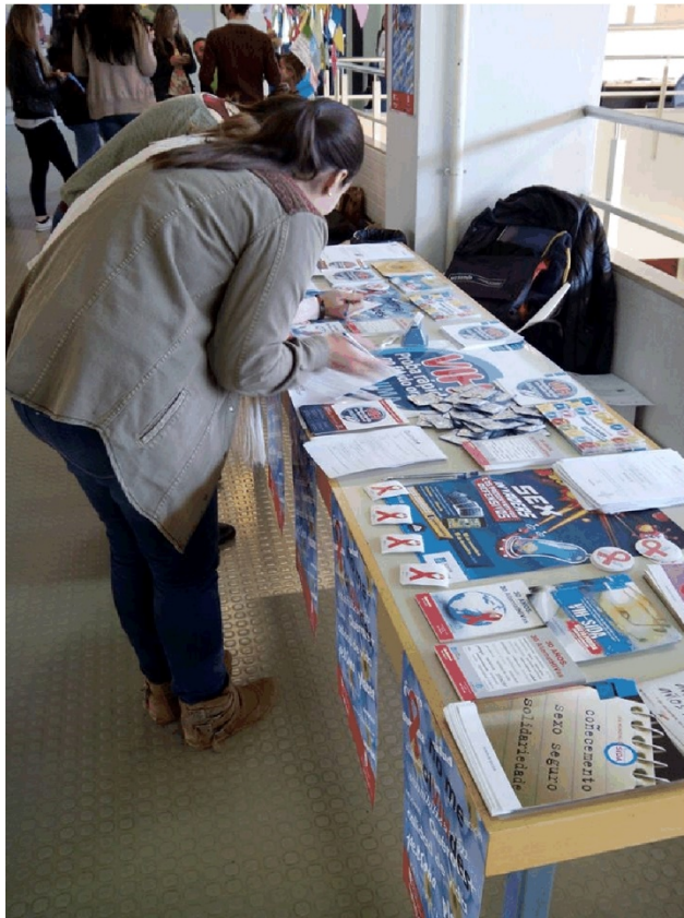
Mesa informativa na Biblioteca Intercentros de Lugo: